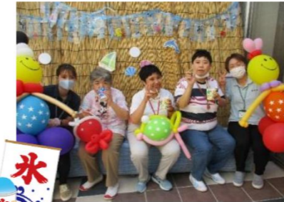
【かき氷・流しそうめん】