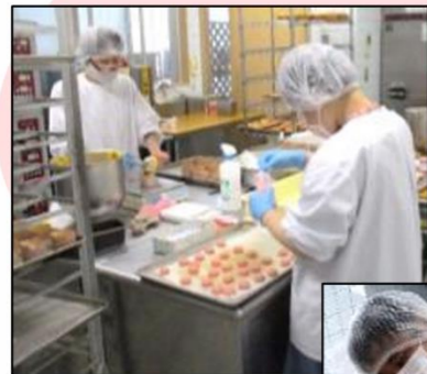
粉の計量 生地の流れ込み 表示シール貼り ラッピング等