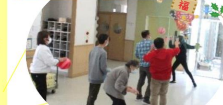
【節分・豆まき】 恵方巻を食べた後は、鬼退治!