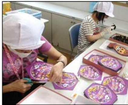
焼き菓子ギフトのラッピング作成