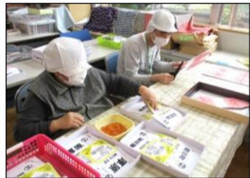
運送会社の荷物に貼るラベルの作成