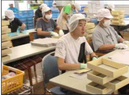
菓子箱・お土産の箱の箱折り作業