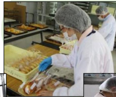
粉の計量 パン生地の成形 袋詰め 仕分け等