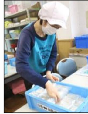
家具修理キットの袋詰め