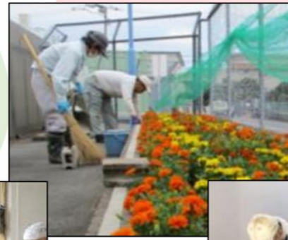
花壇の手入れ アパート清掃 野菜の 販売準備等