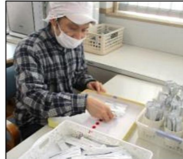
粉ドリンクスティック入れ