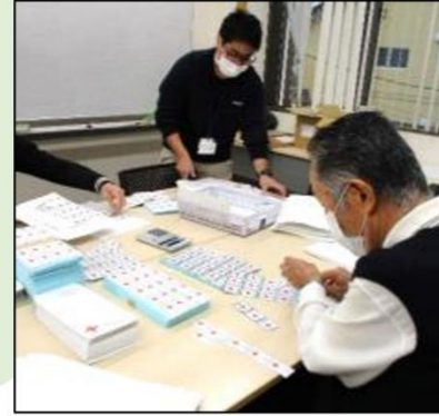
書類等の封入作業