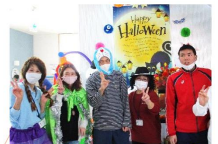
【ハロウィン・交流会】